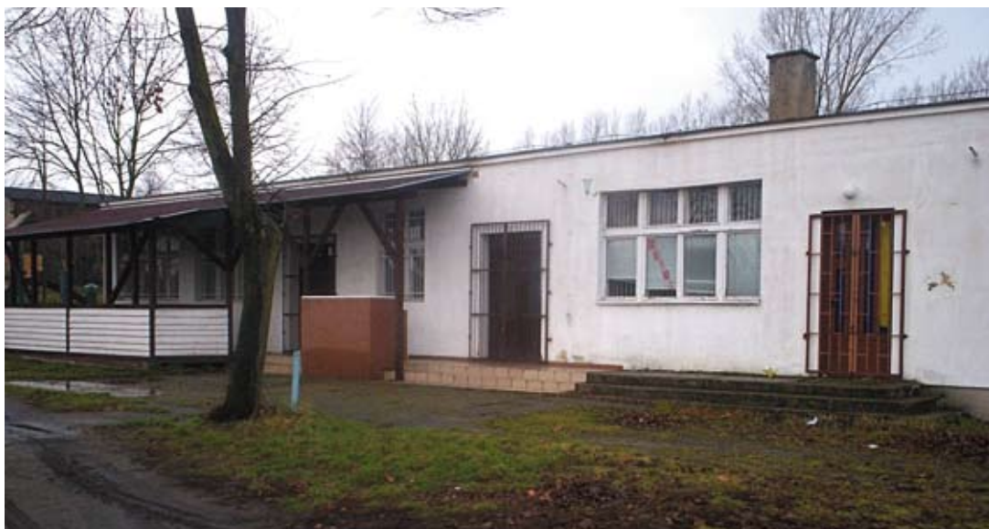
Świetlica wiejska w Świątnikach

Firma remontująca plac urządziła dojazd do przepompowni wody. Działkę ogrodzono ze wszystkich stron, od strony szosy i za placem, gdzie znajduje się brama zamykana na kłódkę. Bezpieczne wejście jest z boku od strony świetlicy. Na całej długości działki pod płotem posadzono kwiaty i krzewy ozdobne, rozmieszczone zostały ławeczki. Dzieci wreszcie doczekały się placu zabaw z prawdziwego zdarzenia, wyposażonego w bezpieczne drewniane urządzenia, piaskownice i ławeczki, a dorośli mieszkańcy – miejsca spotkań na wolnym powietrzu i wieczorów spędzanych przy wspólnym ognisku.