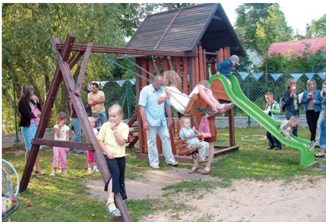
Plac zabaw w Dziechcińcu