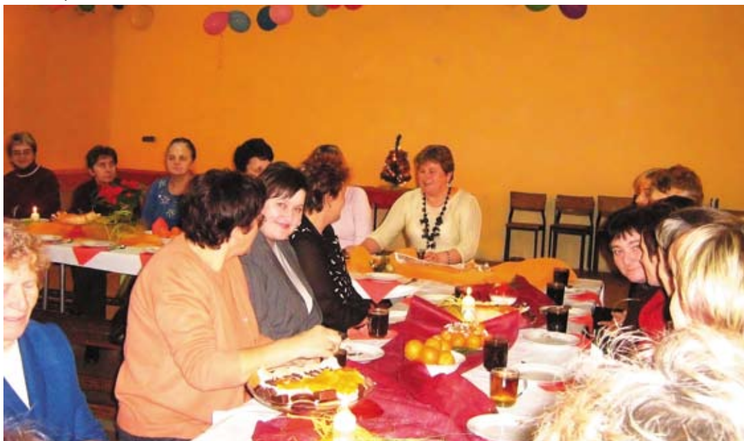
Spotkanie członkiń KGW w Witkowie

i zabrać się do pracy. Dziś w naszym kole jest 48 pań, od najmłodszych dwudziestoletnich dziewczyn po seniorki. I bardzo się cieszymy z tego, że możemy wspólnie spotykać się, szkolić i zdobyć nowe umiejętności, poznawać ciekawych ludzi, często mieszkających w bliskim sąsiedztwie, a zupełnie nam nie znanych.