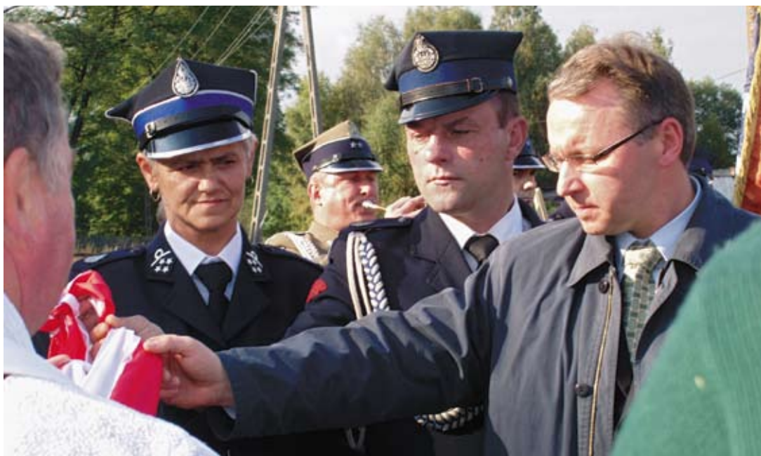
Uroczyste przecięcie wstęgi