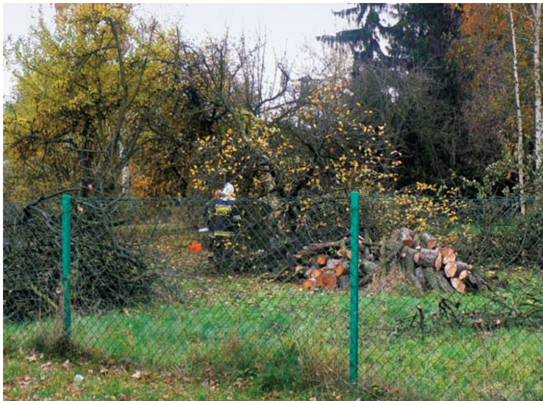
Strażacy wycinają drzewa na terenie przyszłego placu zabaw

młoda i przedsiębiorcza mama pozyskiwała sponsorów na bale szkolne, festyny sportowe i paczki dla dzieci. Z biegiem czasu nabierałam doświadczenia w pracy społecznej i coraz wnikliwiej patrzyłam na to, jak biegnie życie w mojej miejscowości. Zauważyłam, że maluchy, a także dziewczęta i chłopcy w wieku szkolnym, nie mają się gdzie spotkać i wspólnie pobawić na świeżym powietrzu. Jednocześnie znalazłam tereny w Cieninie Kościelnym, które świetnie nadawały się na bezpieczny plac zabaw dla dzieci i młodzieży. Mogłyby być również miejscem spotkań ich rodziców i opiekunów, a także sposobem na integrację młodszego i starszego pokolenia mieszkańców mojej wioski.