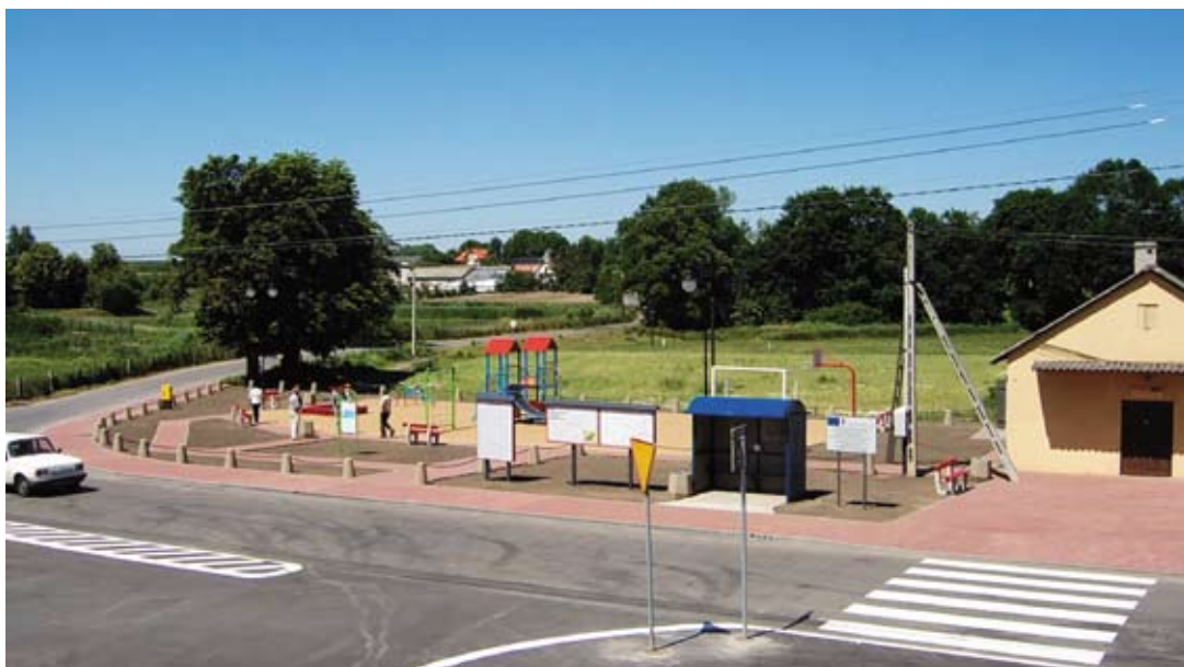
Nowoczesne centrum Cerekwi