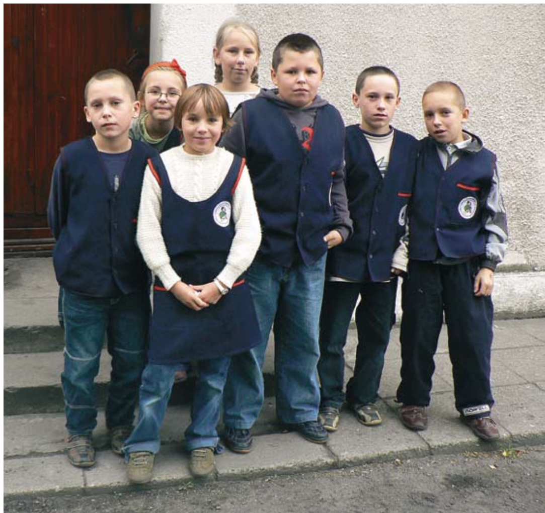
Latem dzieci z Cienina Kościelnego będą miały bezpieczne miejsce do zabawy