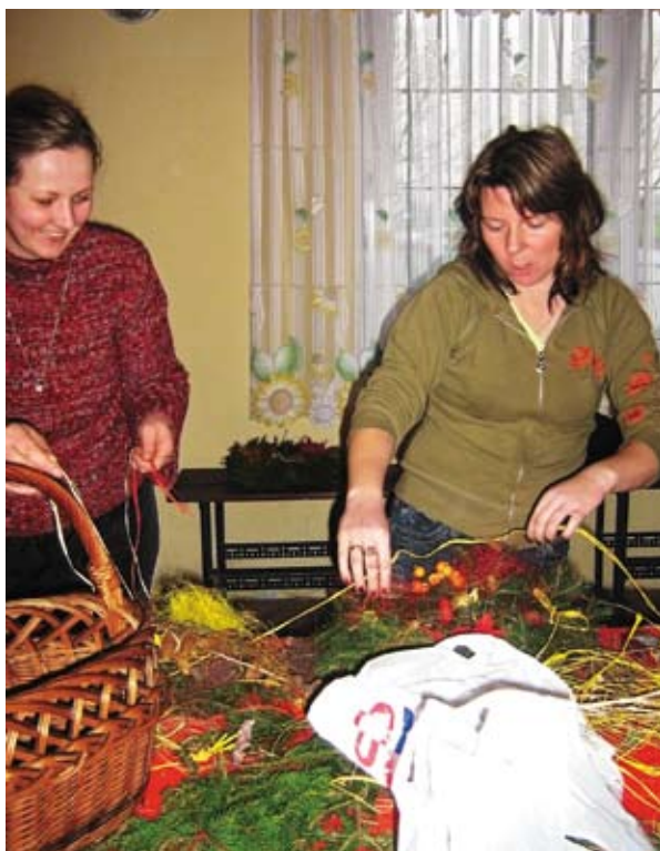
KGW w Witkowie – zajęcia rękodzielnicze

i zabrać się do pracy. Dziś w naszym kole jest 48 pań, od najmłodszych dwudziestoletnich dziewczyn po seniorki. I bardzo się cieszymy z tego, że możemy wspólnie spotykać się, szkolić i zdobyć nowe umiejętności, poznawać ciekawych ludzi, często mieszkających w bliskim sąsiedztwie, a zupełnie nam nie znanych.