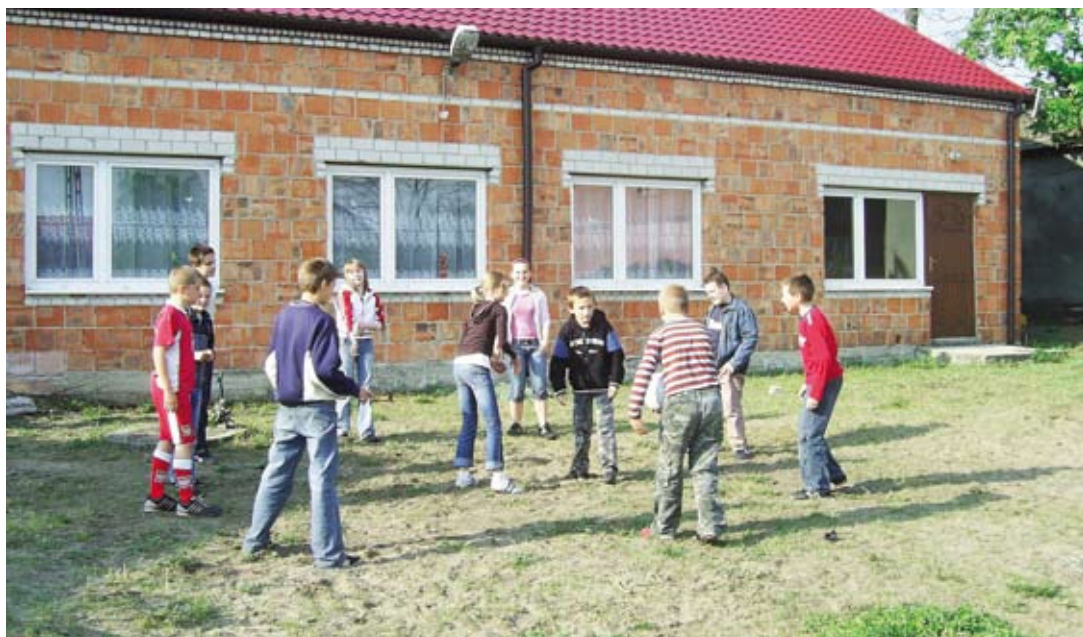
Gra w piłkę przed budynkiem świetlicy wiejskiej w Bielinie