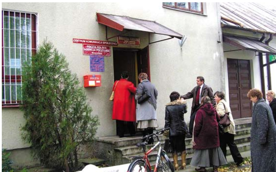
Z Centrum Komunikacji Społecznej korzysta co najmniej kilkanaście osób dziennie