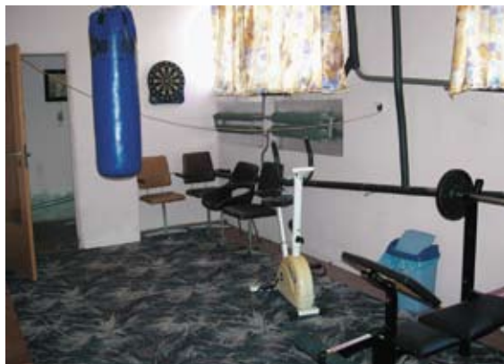
Siłownia w świetlicy wiejskiej w Żabińcu