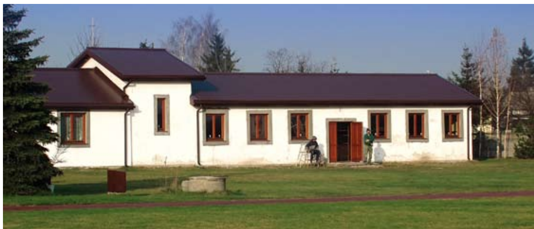
Kaplica parafialna w Bramkach