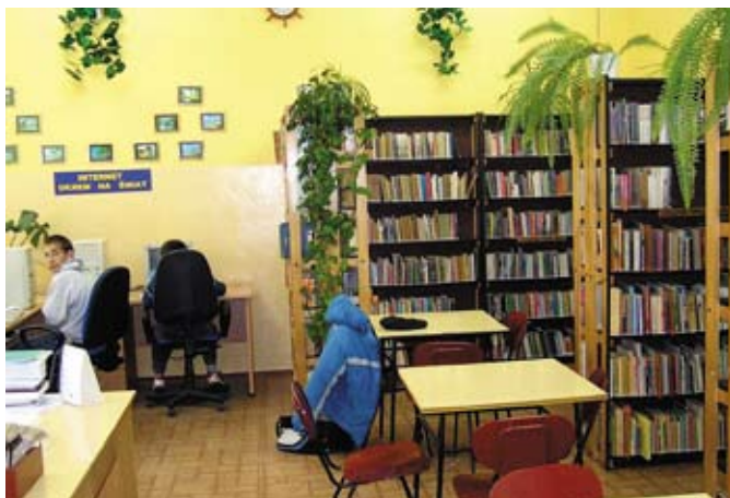
Centrum Komunikacji Społecznej – elektroniczne i książkowe źródła informacji