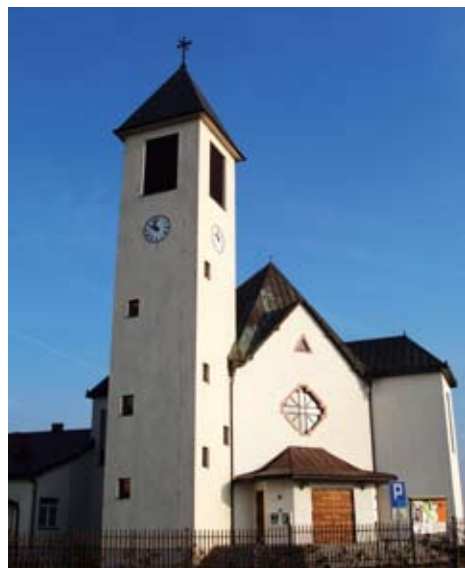
Nowy kościół w Bramkach

Dynamiczny rozwój miejscowości sprawił, że potrzebny stał się nowy, większy kościół. Konsekwentnie w 2007 r. świątynia powstała z inicjatywy mieszkańców i została zbudowana dosłownie ich rękami. O determinacji mieszkańców oraz konsekwencji w dążeniu do celu świadczy fakt, że przy budowie świątyni był zatrudniony tylko jeden fachowiec murarski.