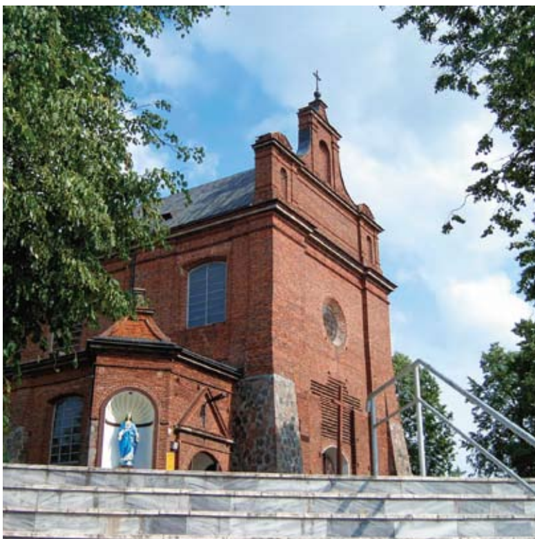
Zabytkowy kościół w Cerekwi