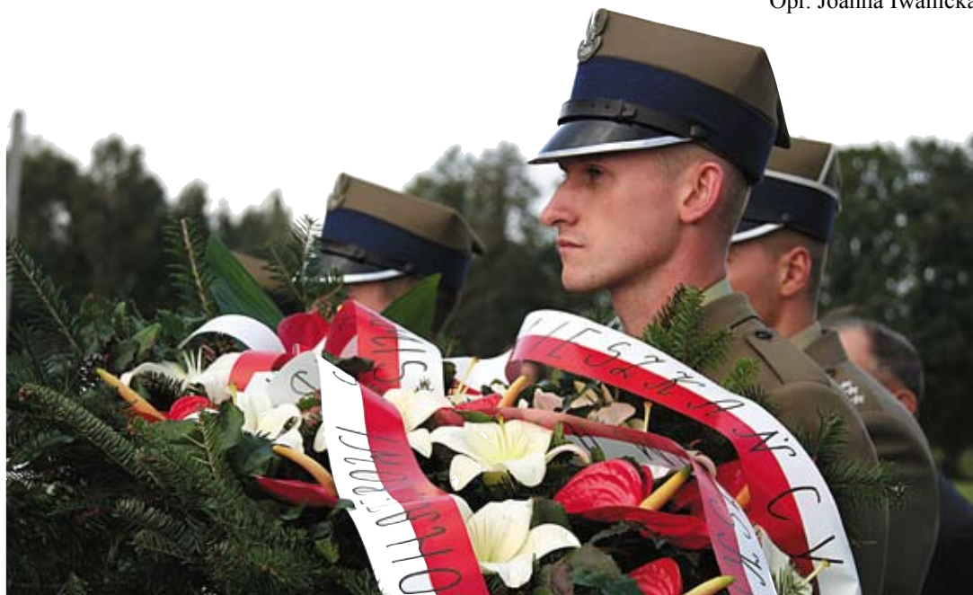
Kompania honorowa Wojska Polskiego podczas uroczystej inauguracji