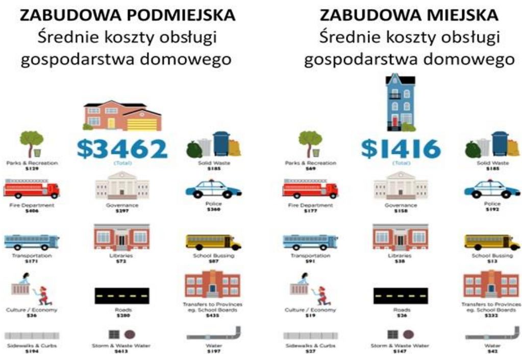
Infografika 1. Porównanie kosztów obsługi według funkcji komunalnych (Thompson 2013).

Wysokie koszty różnych modeli przestrzennych, w tym suburbanizacji, są przedmiotem badań w krajach rozwiniętych. David Thompson z zespołem badaczy Uniwersytetu w Ottawie przeprowadził analizę porównawczą kosztów obsługi gospodarstwa domowego w zabudowie podmiejskiej ( suburbia ) z kosztami gospodarstwa domowego w mieście, w prowincji Halifax w Kanadzie. Analiza objęła kilkanaście zadań komunalnych, w tym takie jak: parki i rekreacja, wywóz śmieci, straż pożarna, policja, transport publiczny, dowożenie dzieci do szkoły, kultura, drogi, utrzymanie ciągów pieszych i chodników, kanalizacja i przelewy burzowe, zaopatrzenie w wodę.