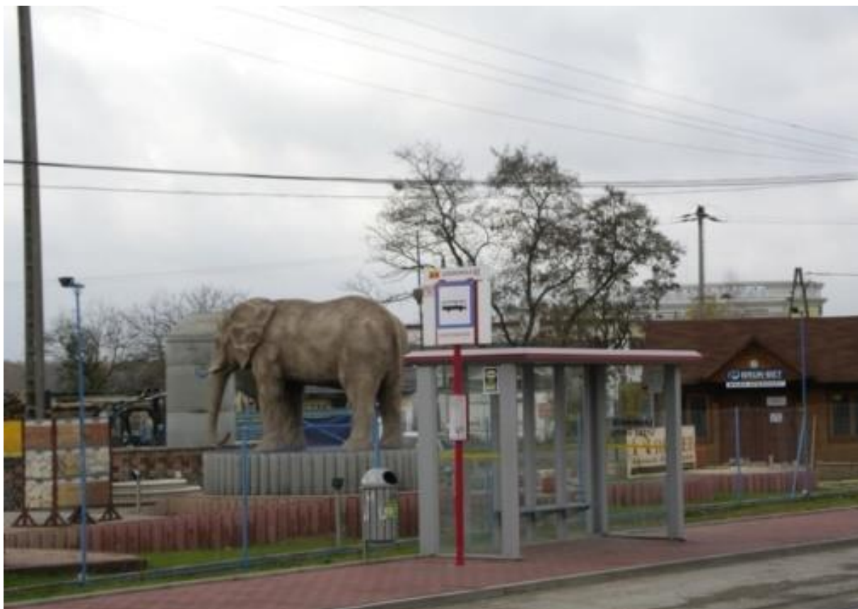
Fot. 1. Przykład chaosu i brzydoty w jednej z podwarszawskich gmin

Widoki takie, jak ten przedstawiony na zdjęciu poniżej, mamy obecnie w Polsce tam, gdzie kontrola planistyczna i budowlana przestały funkcjonować. Osłabiając planowanie przestrzenne i kontrolę budowlaną, zachęcamy do samowoli urbanistycznych i budowlanych, tudzież utrudniamy inwestowanie, a niekiedy nawet pozbawiamy je sensu ekonomicznego i społecznego.