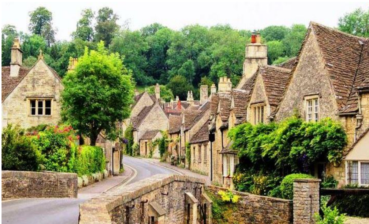
Fot. 3. Południowe Cotswold - regionalne wytyczne dotyczą nie tylko reklam – również architektury, materiałów budowlanych, gabarytów budynków, dachów etc. ( Cotswold Design Code ).

ministra do interpretacji przepisów. Dzięki jeszcze bardziej szczegółowym regulacjom prawnym i architektonicznym na poziomie lokalnym (np. Cotswold Design Code ) krajobrazy poszczególnych regionów mają urodę parków, a wartość nieruchomości jest bardzo wysoka.