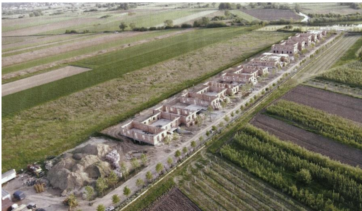
Fot. 2. „Urbanistyka narolna”

Straty w dziedzinie osadnictwa wynikające z wadliwej, ekstensywnej i nieracjonalnej struktury przeznaczania oraz zagospodarowania terenów dotyczą przede wszystkim infrastruktury społecznej i technicznej. Do rozproszonej i chaotycznej zabudowy gmina nie jest w stanie doprowadzić dróg, wodociągów, kanalizacji oraz sieci energetycznych, a jeśli nawet to zrobi to później ma problemy z utrzymaniem tej infrastruktury. Również zapewnienie odpowiedniego standardu obsługi komunikacyjnej i usługowej jest niezwykle trudne, ze względu na jej wysokie koszty. Pod względem gospodarczym oznacza to wyższe wydatki i niższą atrakcyjność inwestycyjną takich terenów, pod względem społecznym – niski standard życia na nich, zaś pod względem przyrodniczym – zanieczyszczenie środowiska naturalnego. Niska efektywność ekonomiczna chaotycznego osadnictwa wynika też z braku koordynacji układów osadniczo-funkcjonalnych, tj. oddalenia od siebie miejsc zamieszkania, pracy i usług. Ma to również skutki społeczne.