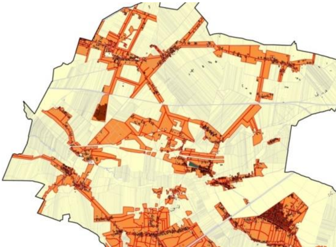
Mapa 1. Wadliwy plan miejscowy. Prawo uniemożliwia scalenia. Jak budować na „paskach” gruntu?

Kolejnym źródłem kryzysu gospodarki przestrzennej jest niejasny zakres prawa własności i doktryna „wolności zabudowy”. Niedookreślenie w ustawach, dotyczących gospodarki przestrzennej prawa własności zwiększyło rangę sądów administracyjnych i spowodowało ich szeroką ingerencję w gospodarkę przestrzenną. Najczęstszym źródłem sporów dotyczących zagospodarowania przestrzeni, trafiających na wokandy wojewódzkich sądów administracyjnych, niekiedy również do NSA, jest interpretacja następujących pojęć: (1) wolność zabudowy, (2) dobre sąsiedztwo, (3) kontynuacja funkcji, (4) kontynuacja zabudowy. W ciągu trzech lat (2013-2016) co najmniej jedno z tych pojęć było przywoływane w orzeczeniach sądów, odpowiednio: 2851 razy (wolność zabudowy), 3504 razy (dobre sąsiedztwo), 6096 razy (kontynuacja funkcji) i 4787 razy (kontynuacja zabudowy) 4 .