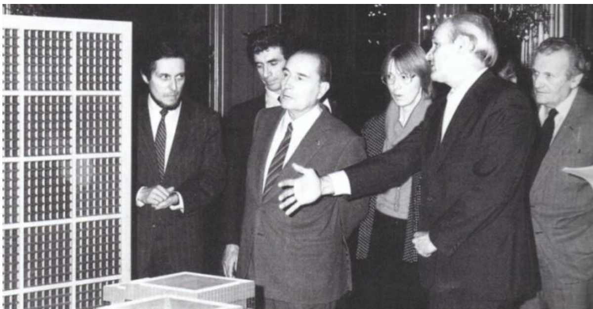
Fot. 4. Architekt Sperckelsen wyjaśnia prezydentowi Mitterandowi koncepcję Grand Arche [Chaslin 1985].

Powyższe przykłady dokumentują fakt duże zaangażowanie polityków w pomnikowe inwestycje celu publicznego. Oprócz tego na przykładzie Musee d'Orsay uwidoczniła się zasadę kontynuacji. Kolejni prezydenci szanują dorobek poprzedników mimo, że nie wywodzą się - jak władcy średniowieczni - z tej samej dynastii. Muzeum budowali gaulista, arystokrata i socjalista – prezydenci wywodzący się z różnych politycznych obozów. Ciągłości prac zawdzięczamy również inne wielkie dokonania urbanistyczne i architektoniczne np. średniowieczne katedry, budowane nieraz przez ponad 100 lat.